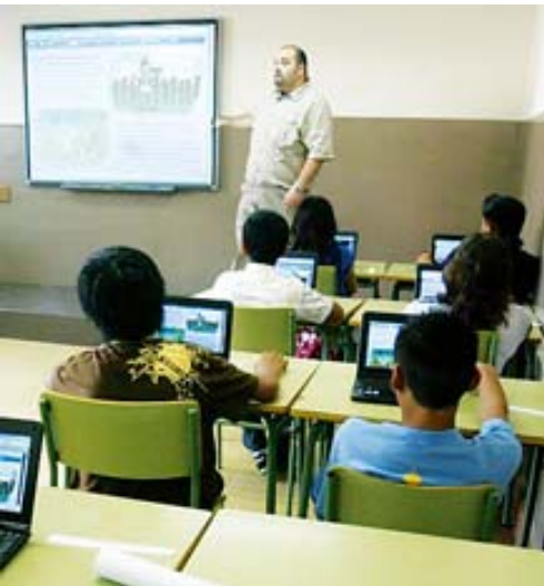
IES Milà i Fontanals (BCN). / Q.P.

Llegir és llegir, dèiem. Els portàtils han entrat a l'aula. Significarà la demonització del llibre?