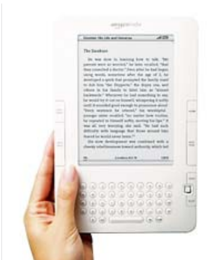
El Kindle d'Amazon, a www.amazon.com .

El DRM és l'acrònim de Digital Rights Management. Amazon ha viscut fa ben poc una polèmica relacionada precisament