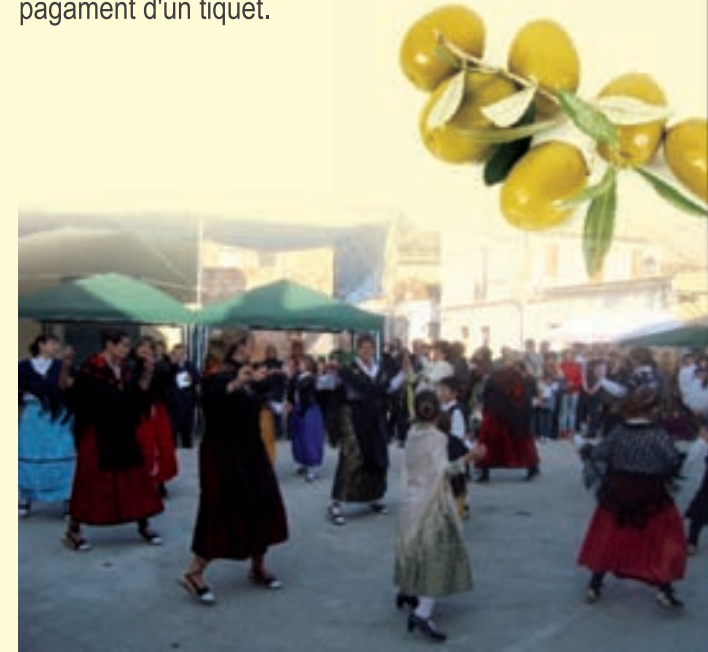
La Jota de Godall

"Durant els dies de la fira, hi haurà visites guiades al nou molí d'oli"