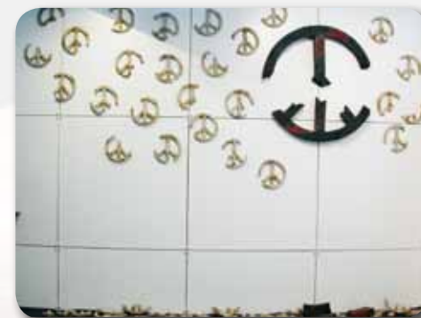
Pau trencada , autor: Ramon Fort

● Museu de Joguets i Autòmats : Exposició Mariscal a Verdú Horari: Dissabte i Diumenge d'11 a 14h i de 16.30 a 20 h